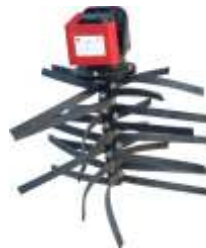
DESLADROADOR COM MOTOR HIDRÁULICO DESLADRO. WITH HYDRAULIC MOTOR DESLADRO. AVEC MOTOR HYDRAULIQUE DESLADRO. CON MOTOR HIDRÁULICO