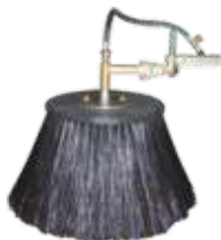
KIT CAMPANULA ANTI-DERIVA D.60 KIT CAMPANULA ANTI-DRIFTING D.60 KIT CAMPÂNULE ANTI-DERIVE D.60 KIT CAMPANA ANTI-DERIVA D.60