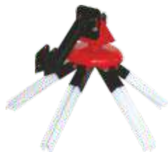
KIT VARREDOURA KIT SWEEPER KIT BALEYEUSE KIT BARREDORA