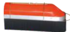
CAMPANULA C/PROTEÇÃO ANTI-DERIVA CAMPANULA C/PROTECTION ANTI-DRIFTING CAMPÂNULE AVEC PROTCTION ANTI-DERIVE CAMPANA C/ PROTECCIÓN ANTI-DERIVA