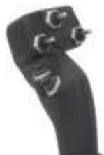
JOYSTICK JOYSTICK JOYSTICK JOYSTICK